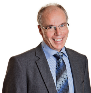
Leiter Fachstelle Schulaufsicht