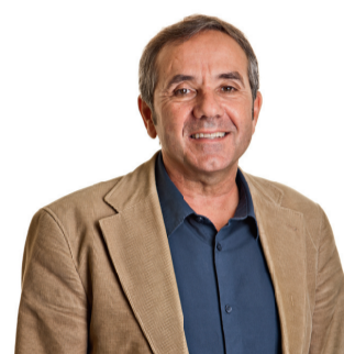
Stv. Leiter Fachstelle Schulaufsicht Schulinspektor Kreis 4

Fachstelle Schulaufsicht deutsch 031 633 83 54